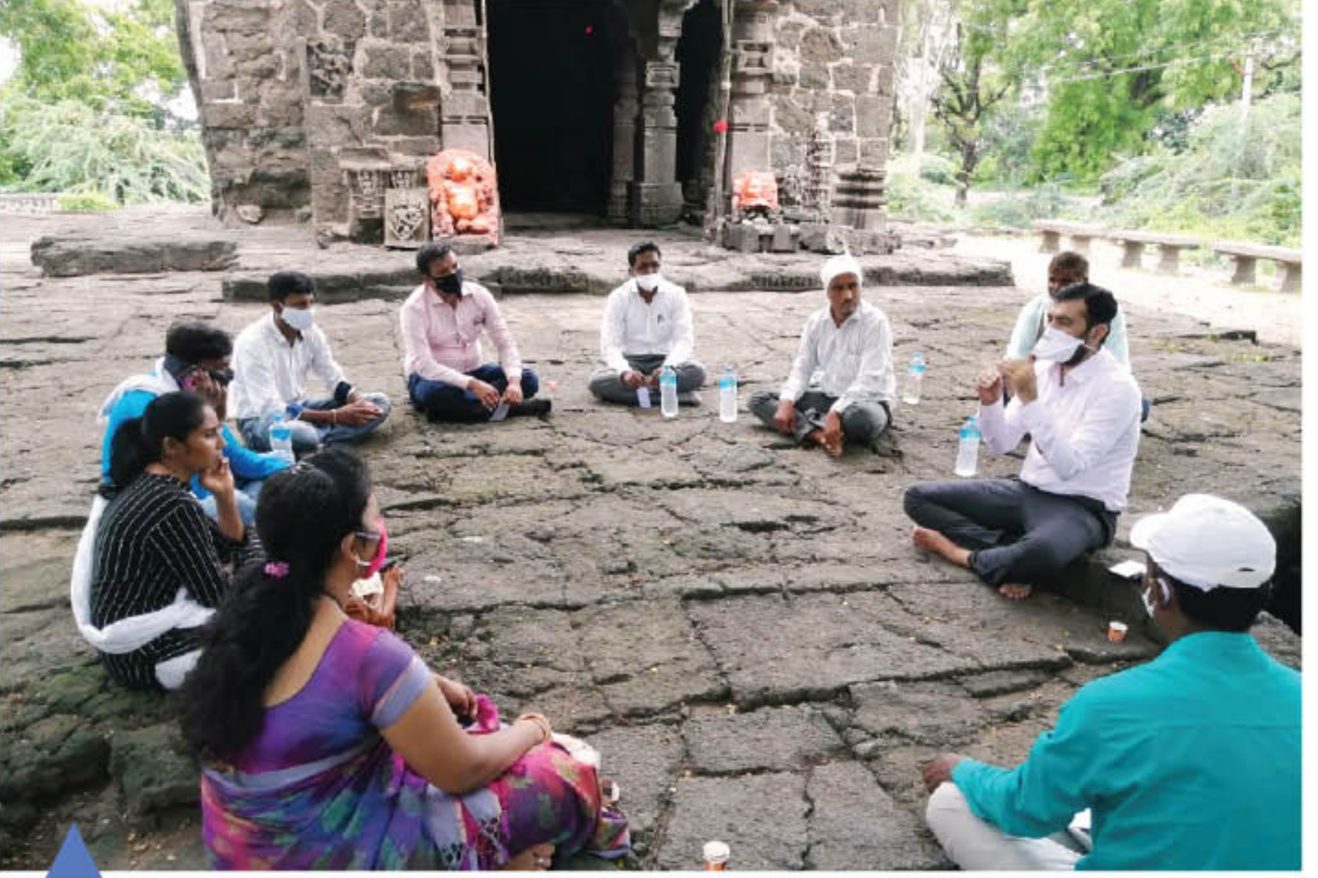
वाघळी गावात नदीकाठी हिरव्यागार जुन्या झाडाखाली प्राचीन हेमांडपंथी मंदिराच्या आवारात 'पाच-पाटील' कामाचा आढावा आणि पुढील कामाचे नियोजन करताना...