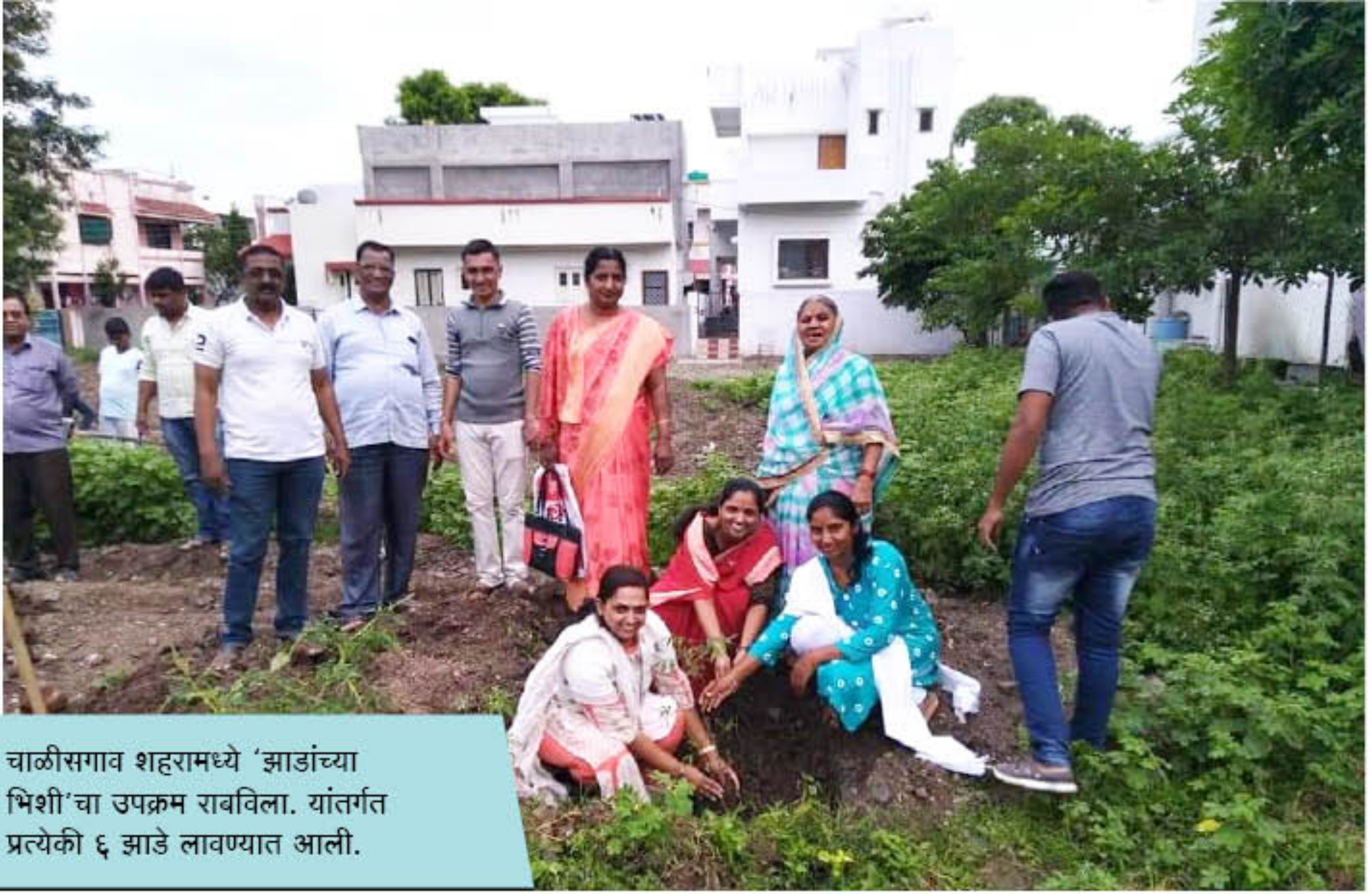
चाळीसगाव शहरामध्ये 'झाडांच्या भिशी'चा उपक्रम राबविला. यांतर्गत प्रत्येकी ६ झाडे लावण्यात आली.